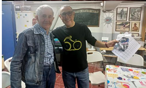
Xerrada d'En Agustín al local social