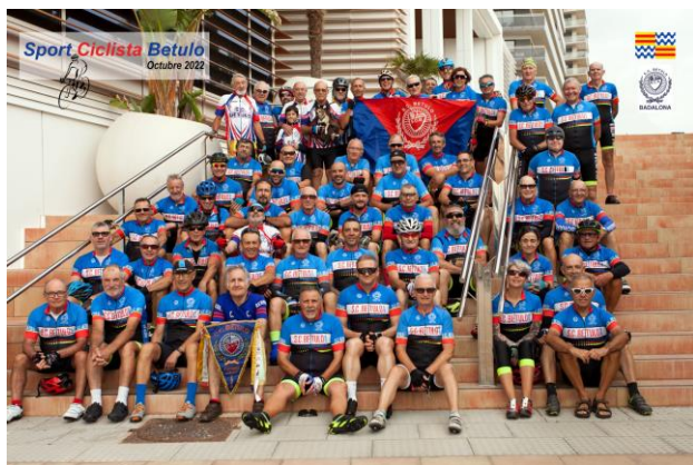
Foto temporada 2022

Us recordem un any més que els socis que vulgueu rebre el Full Informatiu via correu electrònic (e-mail), o bé ens ho comuniquem al nostre e-mail ( scbetulo@eresmas.com ), o passeu pel club i ens ho notifiqueu personalment.