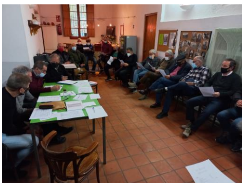
Assemblea Anual Ordinària

Un cop finalitzat l'acte alguns dels assistents a l' Assemblea vam anar al nostre local social i vam prendre un peti pisolabís.