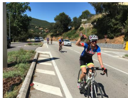
The best of the championship 2019