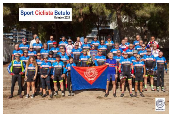
Foto temporada 2021

Recordem a tots els socis que participen a les sortides del Calendari d'excursionisme del S. C. Bétulo tenen l'obligació de dur una llicència federativa en vigor o bé una assegurança d'accidents amb responsabilitat civil.