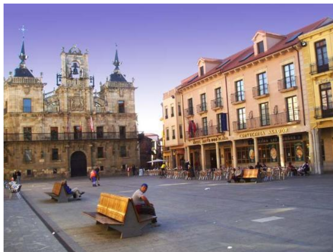
Plaça d'Espanya d'Astorga