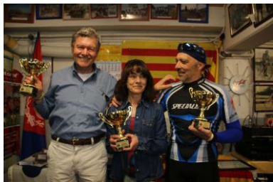
Els Campions de l'any 2015