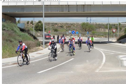
Arribada dels ciclistes a Vimbodí

Com a nota negativa va ser la llarga espera que van tenir que patir els que anaven amb autocar, des de que van arribar fins que va començar la visita al Museu , intentarem corregir aquestes petites errades en properes sortides. Un cop finalitzat l'àpat, vam tornar tots cap a Badalona amb l'autocar, amb la satisfacció de haver-hi aconseguit el nostre objectiu, i de haver-hi passat una jornada molt agradable.